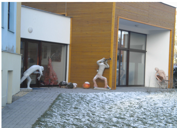
Muzikantům zima zjevně nevadí...

Výtisk zdarma - malý příspěvek na tisk časopisů vítán.