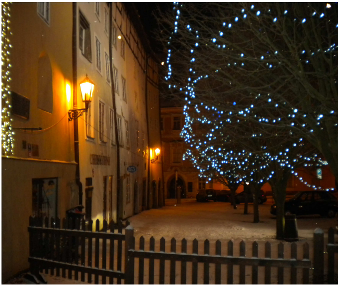
Pro sváteční naladění....