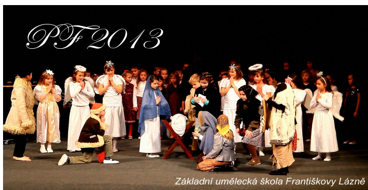
Základní umělecká škola Františkovy Lázně