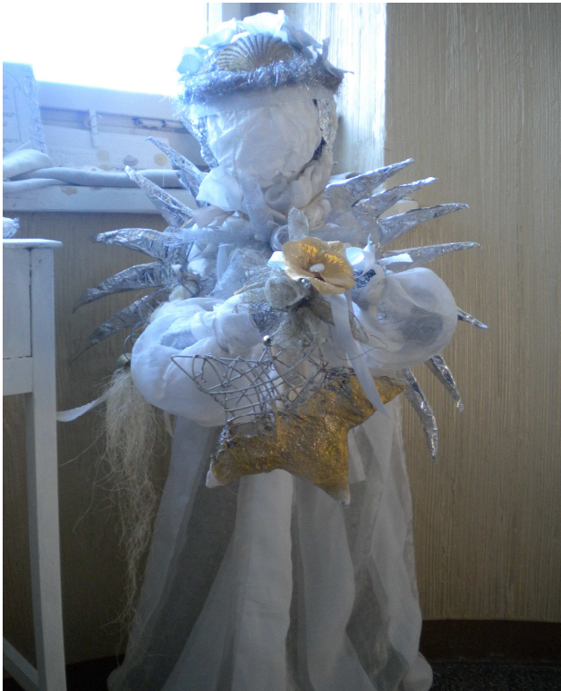
Vánoční výzdoba v naší škole... To je práce našich výtvarníků.