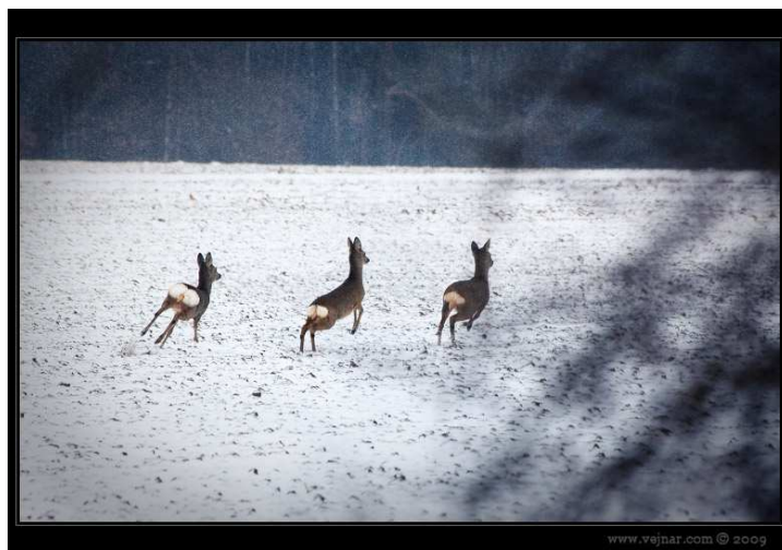
Když má fotograf na lvýcházce zimním lesem štěstí, může zachytit taky takovéto pádící stádečko srnek.