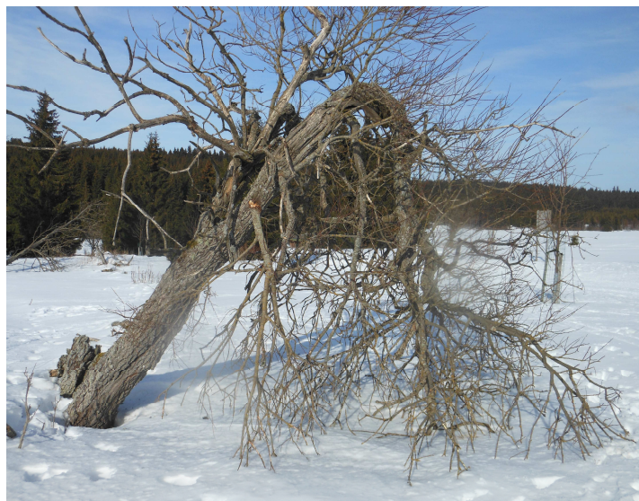
Sníh a vichry strom dokonale ohnuly—ale nezlomily.