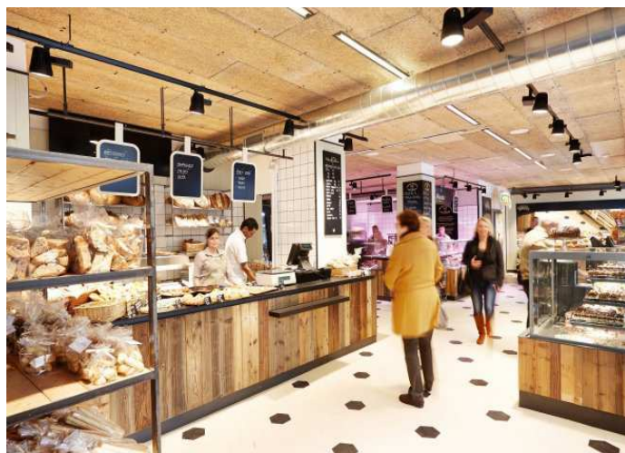
Ilustrační fotka je z jedné velké tržnice v Praze