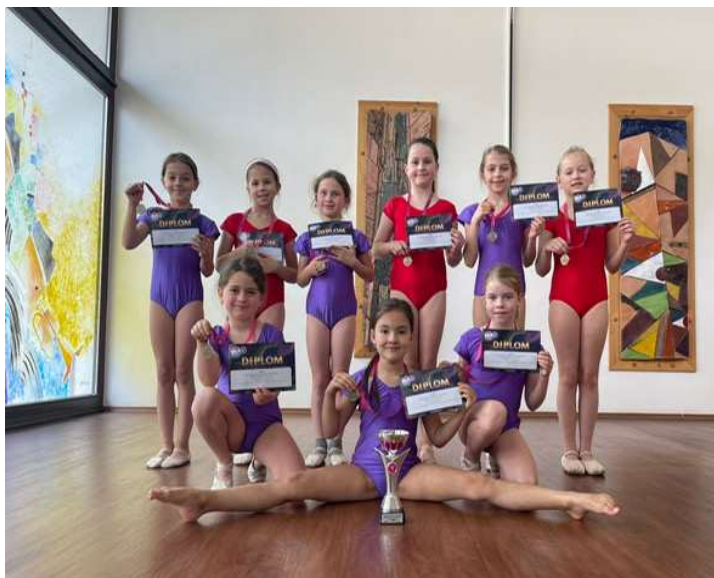
Na snímku D. Dusové skupina mladších tanečnic.

První námět Něco mezi námi je má v sobě prvky mystiky. Choreografie se zaměřila na zachycení energie, která je mezi lidmi, jak ta pozitivní, tak i negativní. Postupně jsme základní myšlenku rozvíjeli v příběhu, který děti zaujal a i bavil. Porota na tom ocenila zejména věrohodnost a originalitu přístupu ke zvolenému tématu.