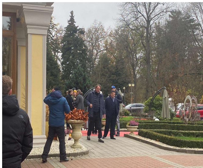
Tyto snímky byly pořízeny během natáčení. Františkovy Lázně žily naplno kriminálním příběhem natáčeným pro Českou televizi.