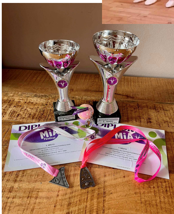
Ocenění, které přivezly mladičké tanečnice.