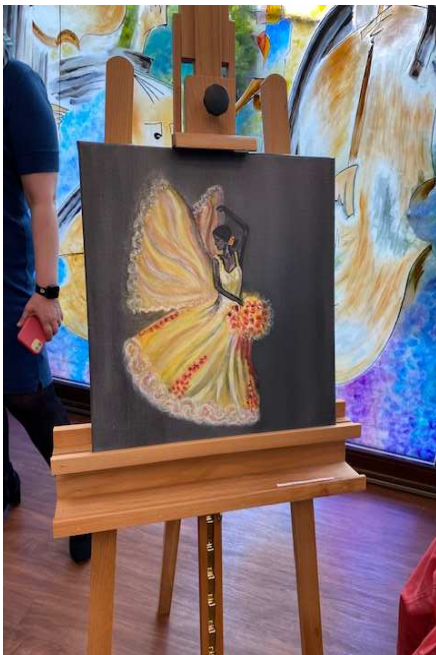
Velice zdařilé a působivé byly i vystavené kresby a keramika absolventů.