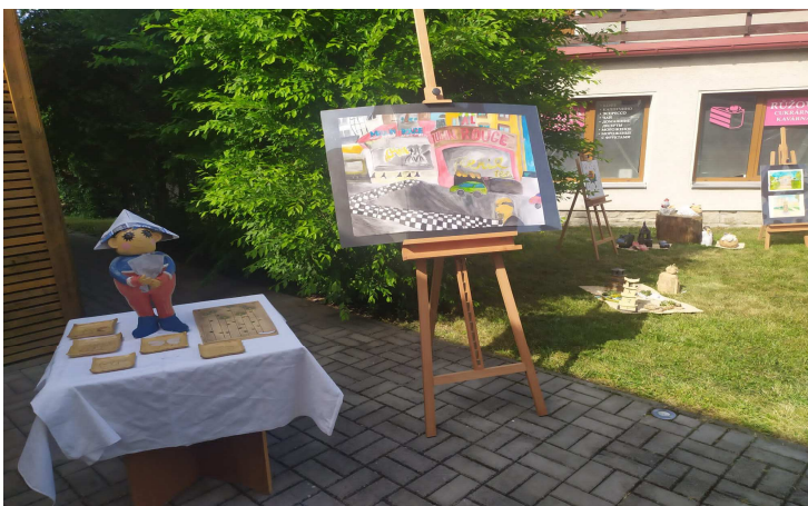
Záběry vystavených prací...