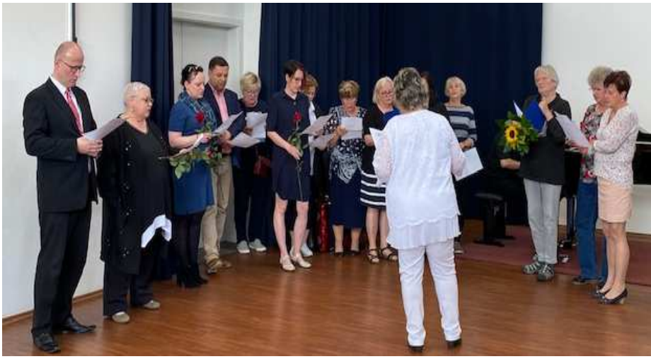
Všichni senioři si společně se svými učiteli zazpívali podle dlouholeté tradice studentskou hymnu Gaudeamus igitur.