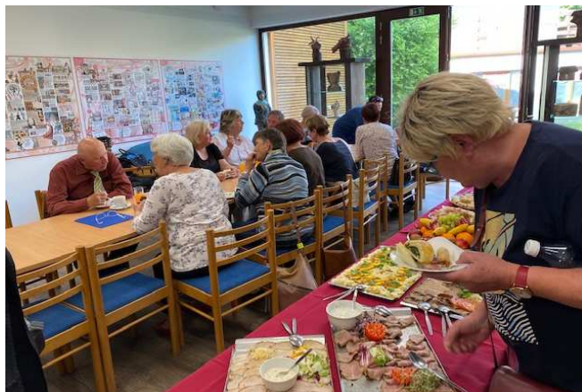
Závěrem si všichni společně hezky popovídali u zajištěného dobrého občerstvení.