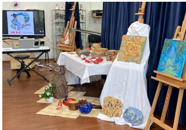
Výstava prací absolventů výtvarného oboru zaujala.

V podstatě nijak. Jistě, řekneme si, co bylo špatně, a jak to zlepšit, ale nedělá z toho nikdo z nás vědu. Někdy se tomu i zasmějeme. Je v tom uvolnění, pohoda. Jinak bych chtěl svým starším žákům vzkázat: Jste prostě skvělí!!! Všichni. Už jen tím, že jsme se k nám přihlásili.