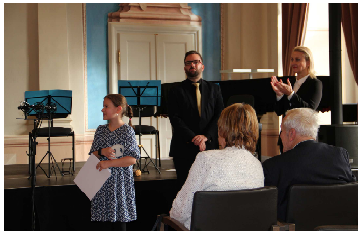
Momentky ze slavnostního předávání ocenění zachytil zástupce ředitelky naší ZUŠ Jára Cimrmana Bohumil Polívka.