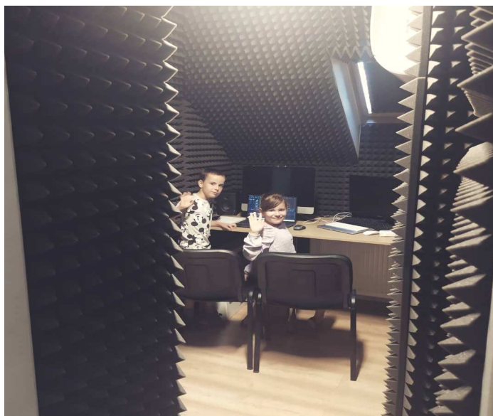
Záběry jsou z nové učebny Filmové tvorby na ZUŠ.