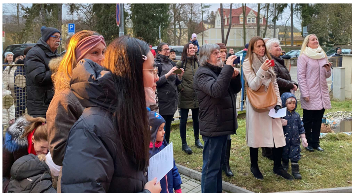
Známé vánoční koledy v podání líbezných dětských hlasů rozezněly před vánočními svátky před ZUŠ Jára Cimrmana.. Přílákaly zájem nejen rodičů, ale i veřejnosti. Program připravili a zajistili učitelky a učitelé školy. Možná se tak zrodila nová a pěkná tradice,