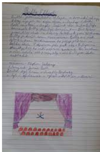
Práce žáků ZUŠ—i ty vznikaly v distanční výuce.