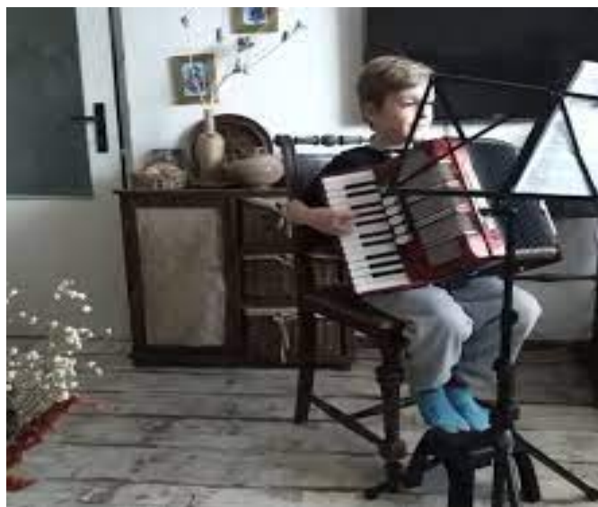
Distanční výuka hudebních oborů na naší ZUŠ krátce ve fotografii...