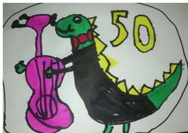
Plakát vytvořený žáky výtvarného oboru v rámci distanční výuky připomíná, že naše škola slaví letos 50. výročí....