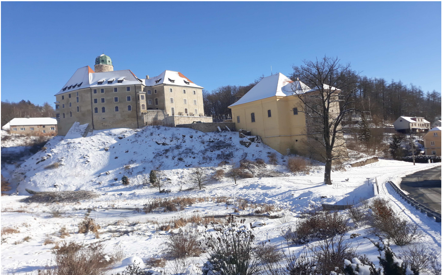
Láďa Sudek na svém výletu pořídil velice zdařilou fotografii historického objektu—zámku v Libé ještě pod sněhem.