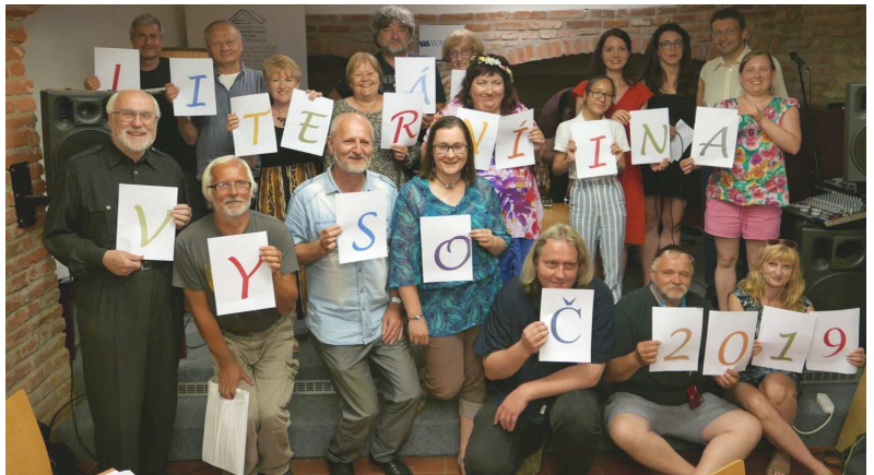
Mezi oceněnými v soutěži LITERÁRNÍ VYSOČINA 2019 je Lenka dívka v pruhovaných kalhotách.

S každým výdechem odchází veškeré mé myšlenky, jež mě táhnou dolů