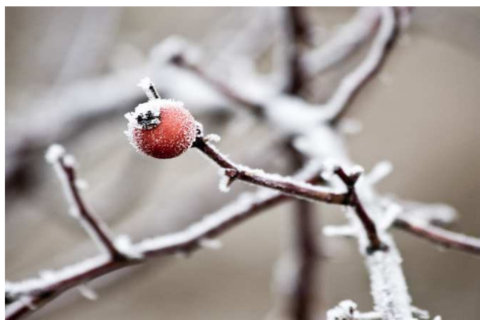
Kráska, ze které jde mráz..

Petr zjistil, že ten důchodce vlastně byl ten šle- nec, a to všechno dělal jen pro svou radost. Všechny roboty a odlety i plány řídil on sám. Byl to starý pán, měl černé vlasy, dlouhý nos, malá ústa a malé uši, zele- né zlé oči. Byl pořád celý v černém oblečení. Teď už ale má na sobě vězeňské hadry. Marek Stolarik