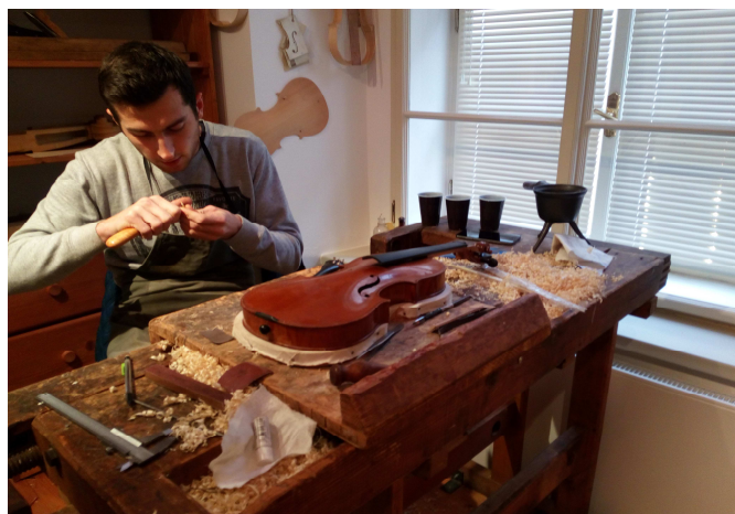
Tuto fotografii jsme pořídili v adventním čase v Muzeu v Chebu, kde se kromě jiného představili svým umem mladí z chebské houslařské školy.

Martina vůbec netušila, že ten cizí pán (zachycený na záznamu) se celou dobu staral o její matku a vyprávěl jí o Martině. Ano, celou tu dobu, kdy její matka pobývala v ústavu. Také všechno řekl panu Havlovi. Nikdy už od té doby neměla šanci mu poděkovat, protože ho znovu nepotkala. Mike Le