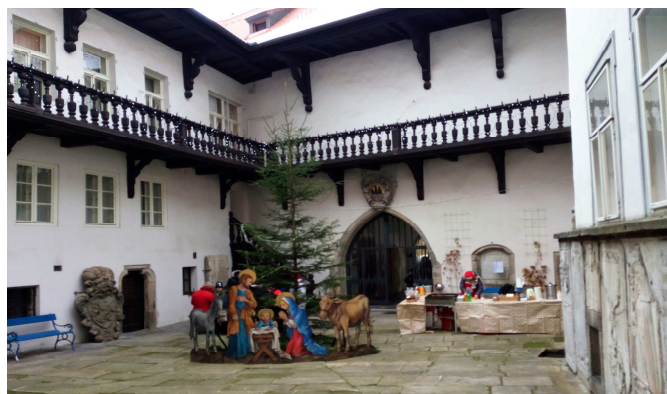
Připomínka vánoc na nádvoří Chebského muzea.