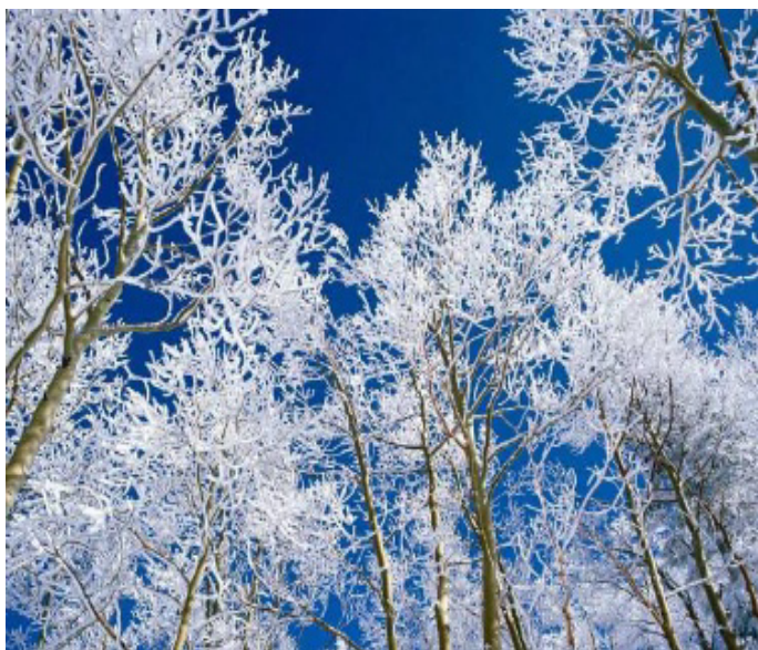
Zima je velký malíř. Takovou krásu vykouzlily mráz a slunce.