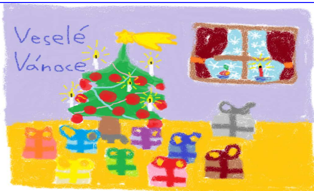
Obrázek namalovala Eliška Sloupová