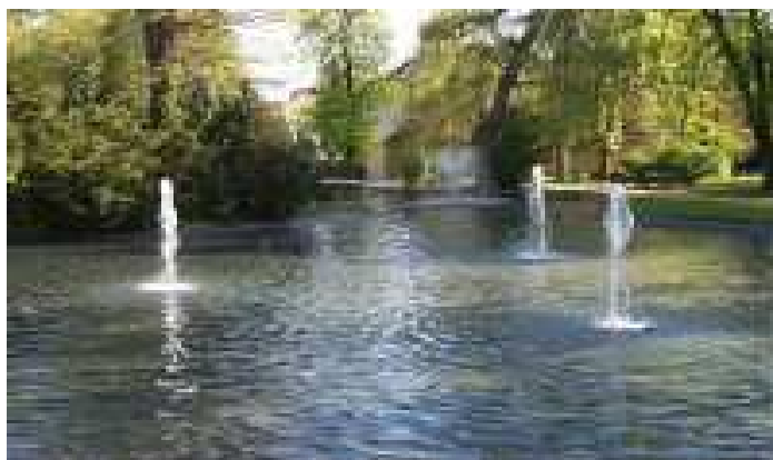
Parkové jezírko s vodotrysky. Také tahle zákoutí vytvářejí jedinečné kouzlo našeho města.