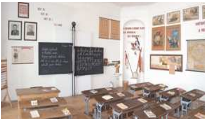
Škola minulosti dávné i méně dávné...