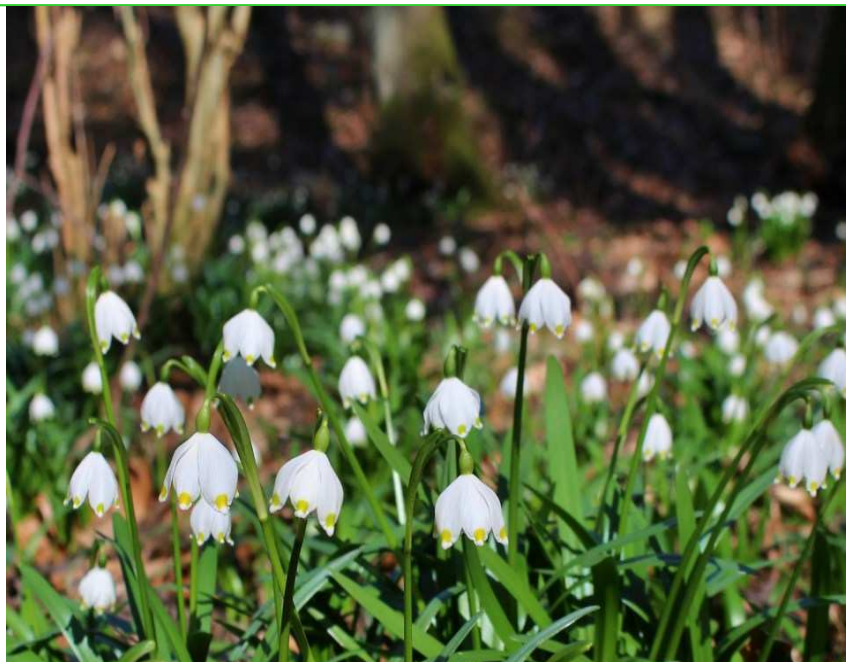
A je tady jaro...